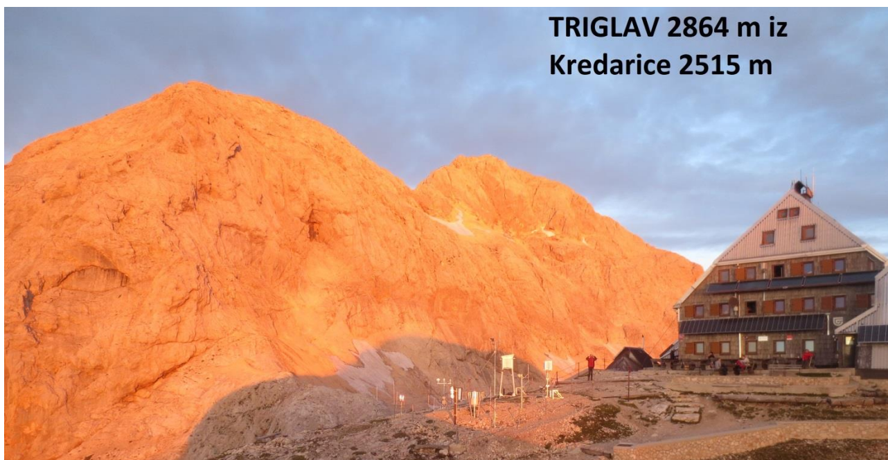
TRIGLAV 2864 m iz Kredarice 2515 m